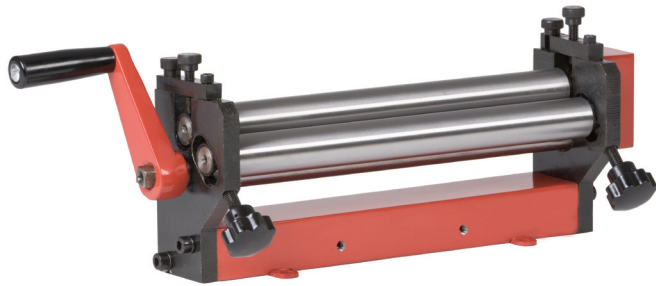
Rundbiegemaschine RU 320 B